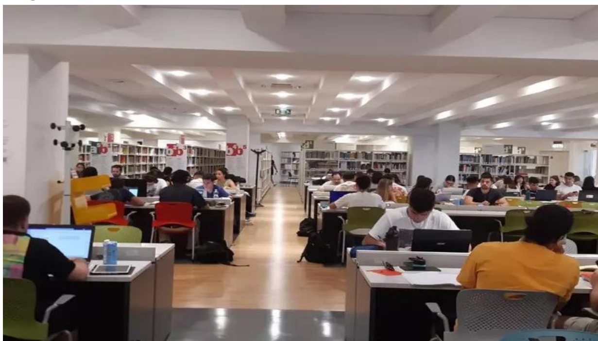
Giovani studenti

Negli ultimi anni la Sardegna sta assistendo a una crescente emigrazione giovanile qualificata. Sempre più laureati tra i 25 e i 39 anni decidono di lasciare l'isola per costruire un futuro in altre regioni italiane o all'estero. Secondo un recente report del Centro Studi Cna Sardegna, basato su dati Istat e Almalaurea, il saldo migratorio medio tra il 2019 e il 2022 è stato di circa 16 laureati ogni mille abitanti, con la Sardegna all'ottavo posto in Italia per intensità del fenomeno.